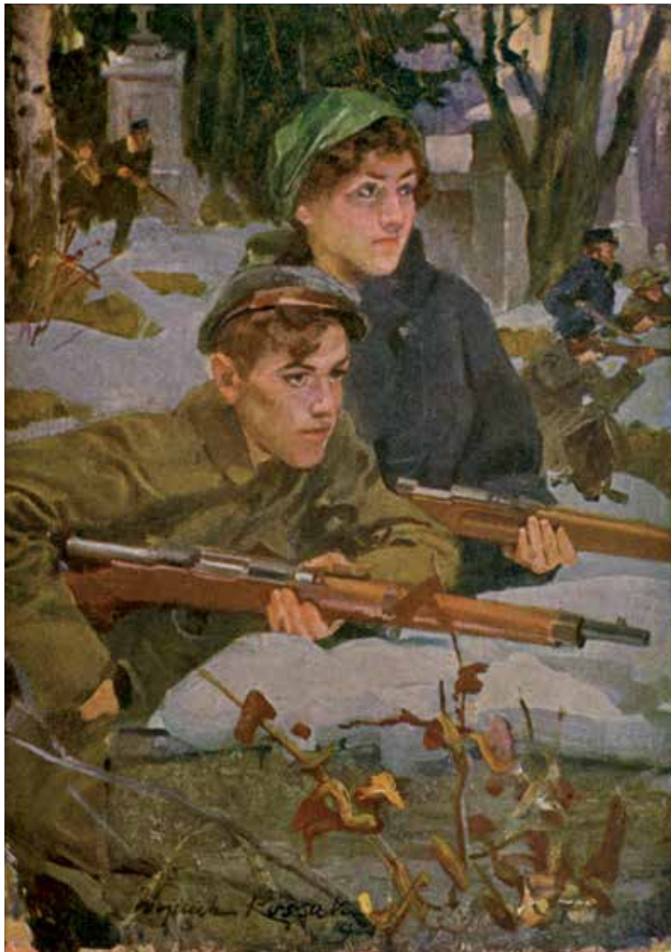
Wojciech Kossak, Orlęta – obrona Lwowa , karta pocztowa, Wydawnictwo Salonu Malarzy Polskich w Krakowie

HARCERSKIE PISMO HISTORYCZNE K W A R T A L N I K TARNÓW, NR 3 [34], WRZESIEŃ 2014 r.