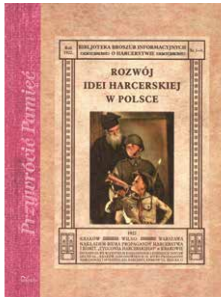
Pierwsza strona jednej z oryginalnych broszur będących częścią książki z serii „Przywrócić Pamięć”, Wydawnictwo „Impuls”, Kraków 2014