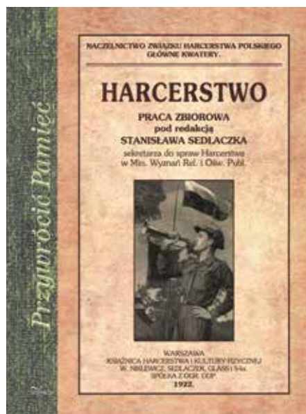
Okładki książek z serii „Przywrócić Pamięć”, Wydawnictwo „Impuls”, Kraków 2014

sprawności, tak wiele miejsca im poświęca. Część druga tego tomu zawiera rozkaz Naczelnictwa ZHP L. 31 z 1 lipca 1920 roku [sic!] wprowadzający Regulamin Prób Sprawności , treść regulaminu oraz programy blisko osiemdziesięciu prób. Dla współczesnego drużynowego, sposób ich przedstawienia – prosty i przystępny – może stanowić nieocenione źródło inspiracji.