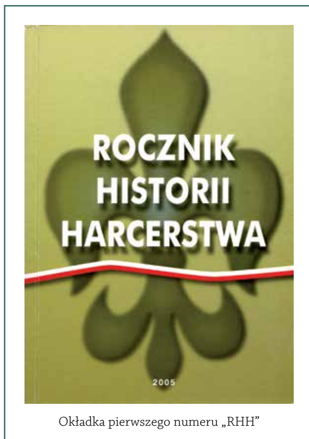
Okładka pierwszego numeru „RHH”