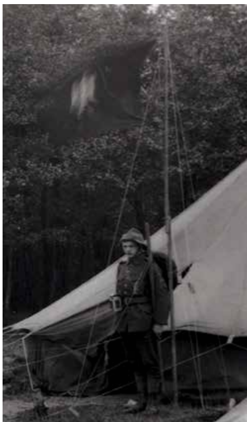
Sztandar wykonany przez polskich skautów w Birmingham w 1913 roku.