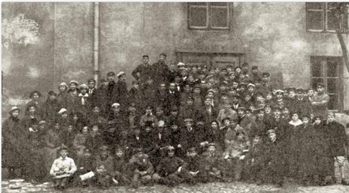
Uczestnicy Zjazdu połączeniowego w Lublinie, 1–2 listopada 1918 r.

szawie: Abyście żadnych wątpliwości nie mieli, że jest to zadanie nie tylko władz szkolnych, ale i czynni-