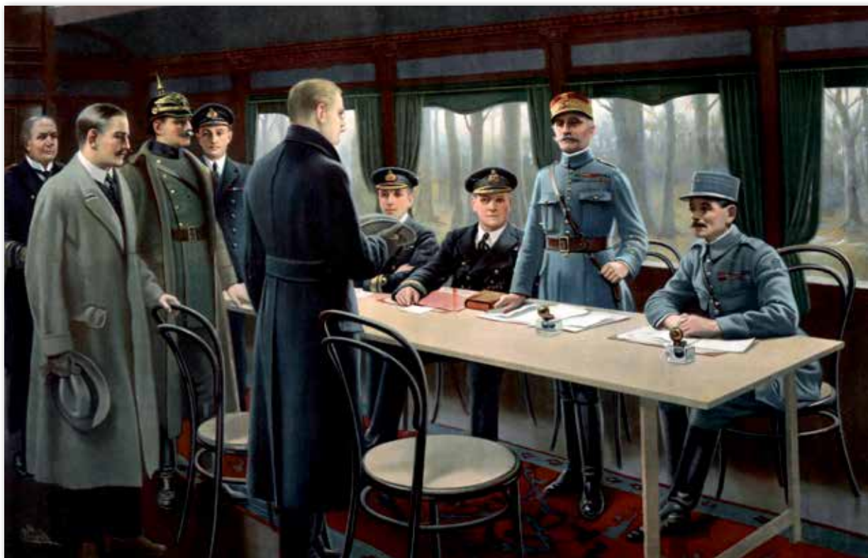
Marszałek Ferdynand Foch przyjmuje delegację niemiecką w wagonie kolejowym w lesie w Compiègne we Francji, 11 listopada 1918 r.

gdzie było najtrudniej, najbardziej krwawo, gdzie trzeba było bez wahania chwycić w wąż dłonie wielki karabin, tam stawała do walki polska młodzież – zwłaszcza harcerki i harcerze. Ich postawa, ich poświęcenie nie było tylko prostym następstwem ich wychowania według Przyrzeczenia i Prawa Harcerskiego. Wielkie oddanie sprawie Niepodległości Polski płynęło z poczucia służby, a sprawność wykonywania rozkazów z ćwiczeń i chęci doskonalenia się wynikającej z metody harcerskiej. Słowa pieśni Marii Konopnickiej: Do krwi ostatniej kropli z żył , były w tamtych czasach tylko potwierdzeniem rzeczywistych postaw i przekonań.