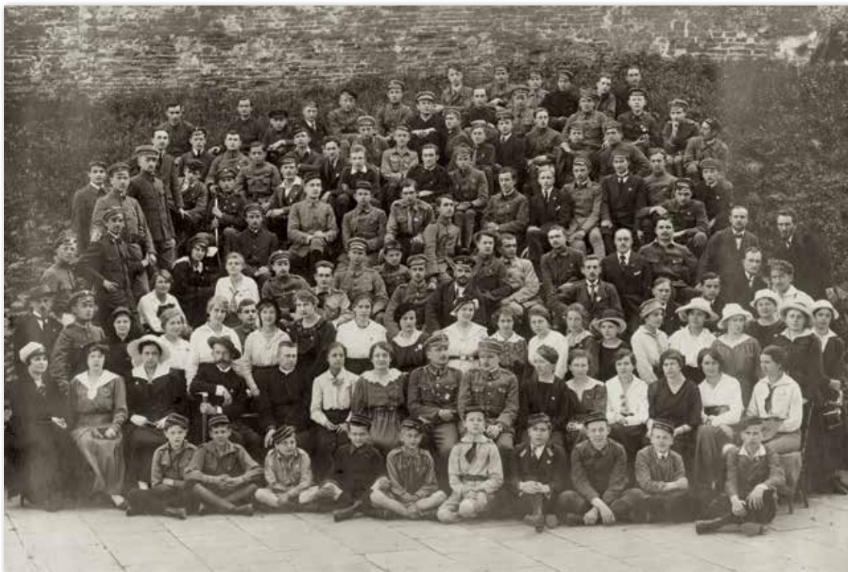
Członkowie władz harcerskich oraz uczestnicy zjazdu w Warszawie, w 1919 r.