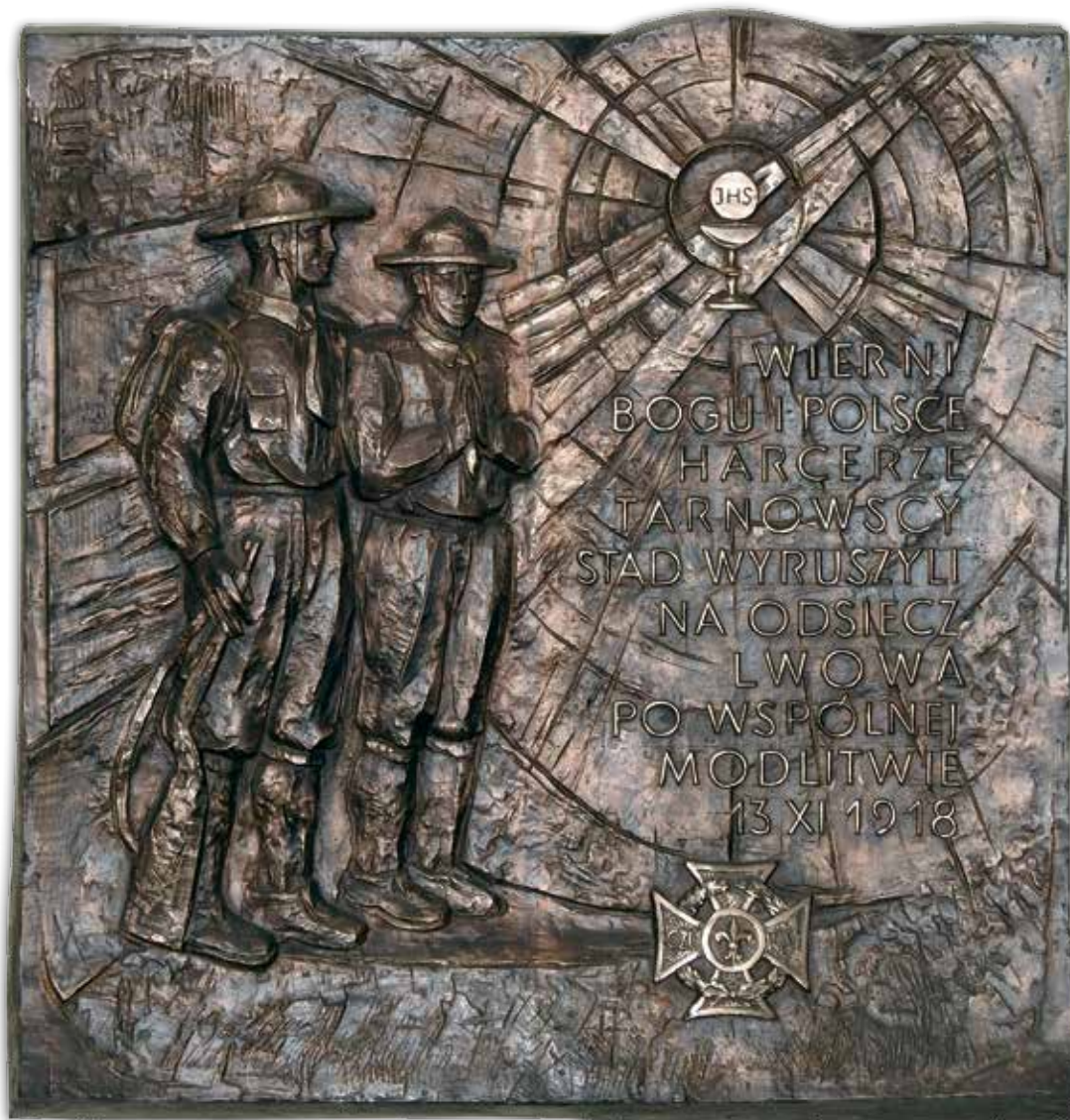
Marek Benewiat, Tablica pamiątkowa/epitafium , brąz, odlew w warsztacie Romana Sapy, w Tarnowie. Lokalizacja: Kościół Filipinów p.w. św. Krzyża i św. Filipa Neri (lewa nawa).

Oddając cześć poległym za Ojczyznę kolegom waszym, wyrażam Wam Harcerze, podziękę i uznanie za dotychczasową służbę.