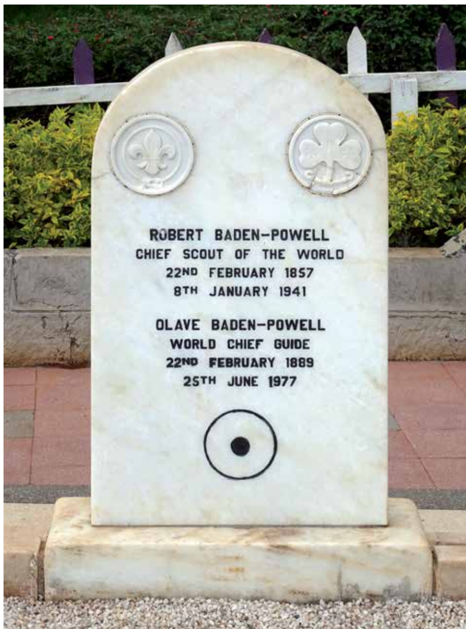
Grób Roberta i Olave Baden-Powell na cmentarzu w Nyeri, Kenia.