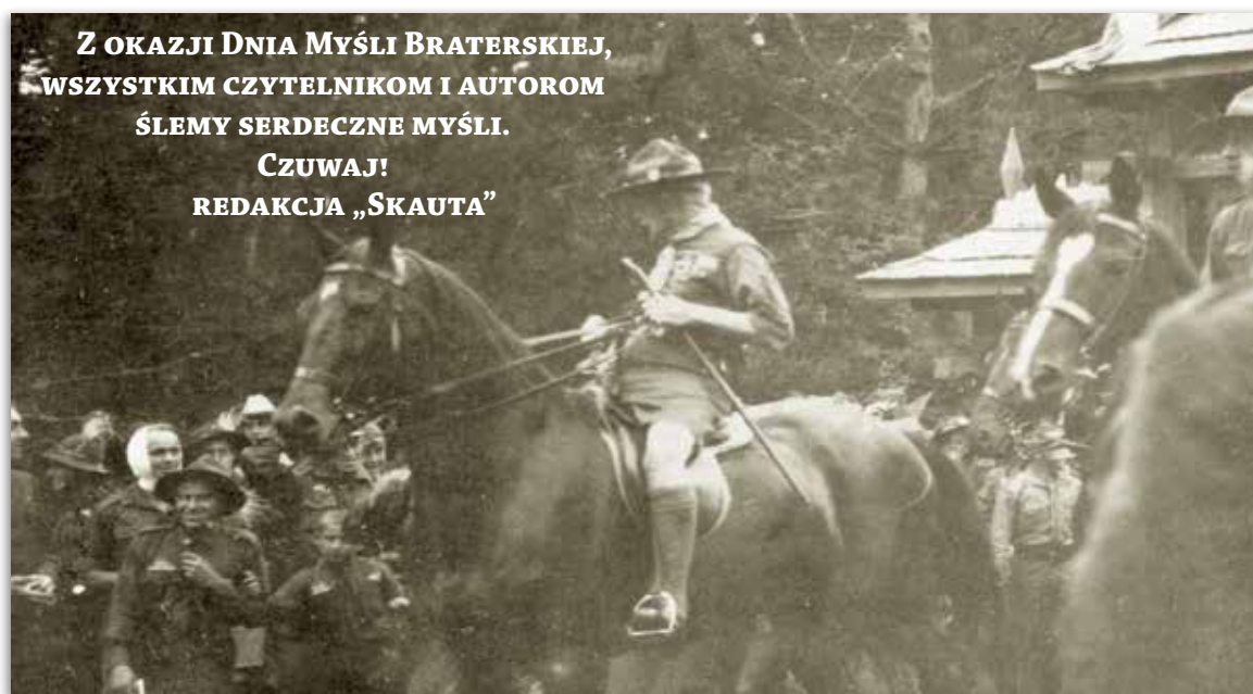
Gen. Robert Baden-Powell na Jamboree w Gödöllő w 1933 roku.