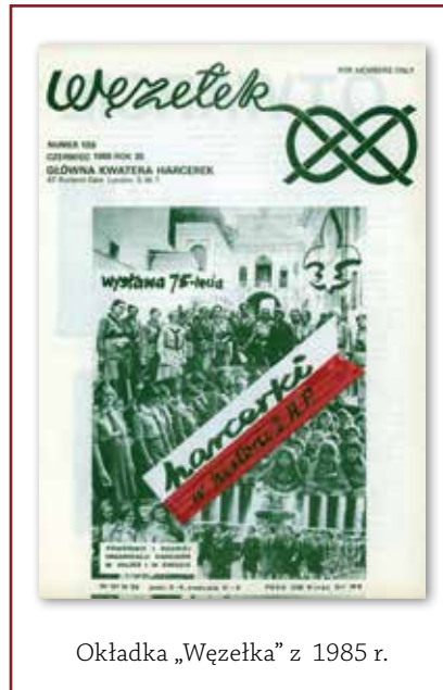
Okładka „Węzełka” z 1985 r.

dalej sprawy wydawnicze (10.6% – 130 s.), wiadomości z terenu (8.4% – 102 s.), konferencje, rady, zjazdy (8.2% – 100 s.), kształcenie (8.1% – 98 s.) itd., a łącznie wydrukowano 1216 stron 17 . W tym samym numerze opublikowano listę autorek dotychczasowych publikacji w „Węzełku”, a liczyła ona 158 nazwisk.