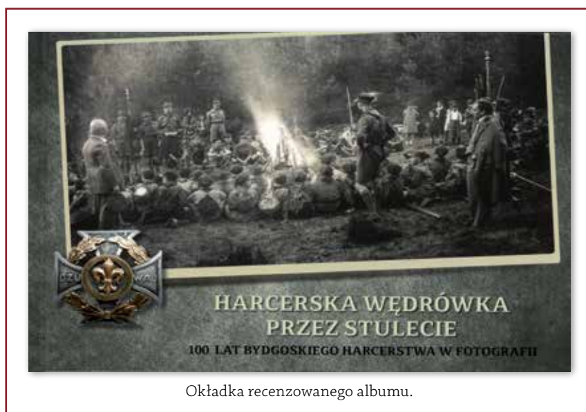
Okładka recenzowanego albumu.