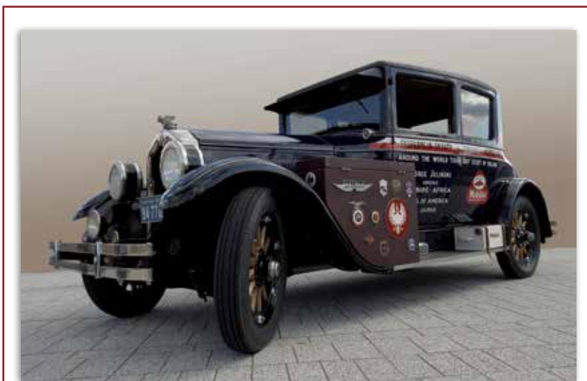
Samochód marki Buick Master Six, którym druh Jerzy Jeliński objechał drugą część trasy: USA, Japonię, do Polski (w latach 1927–1929).

Fot. M. Popiel, Kraków, 14 września 2019 r.