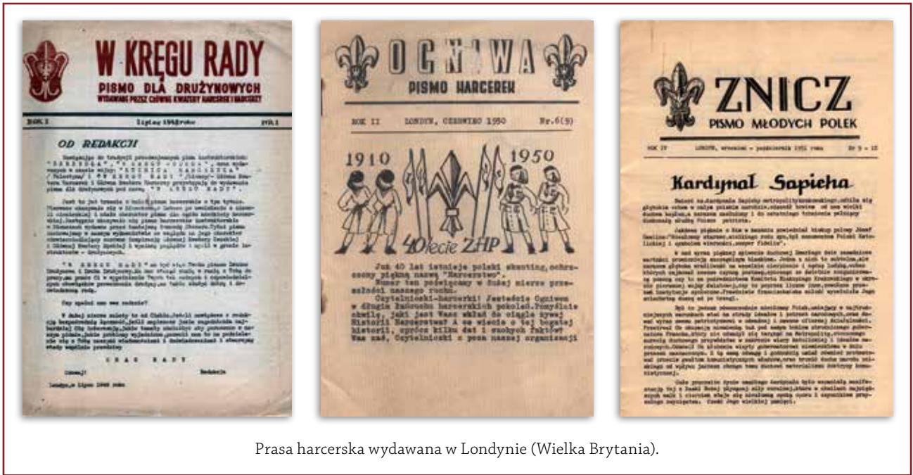
Prasa harcerek wydawana w Londynie (Wielka Brytania).

Afryce, Australii i Azji. Tutaj urzędowały władze harcerek: Naczelna Rada, Przewodniczący ZHP, Naczelnictwo, Główne Kwatery Harcerzek, Harcerzy i Starszego Harcerstwa oraz Organizacja Przyjaciół Harcerstwa. W Londynie miały swoje redakcje pisma harcerek: „Wiadomości Urzędowe”, „Harcerstwo”, „Harcemistrz”, „W Kręgu Rady”, „Znicz”, „Ogniwa”, „Na Tropie” i szereg innych. Tutaj było centrum ruchu wydawniczego.