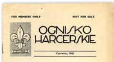
Winieta czasopisma „Ognisko Harcerskie”, Londyn (Wielka Brytania).