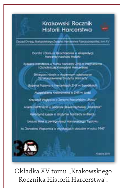
Okładka XV tomu „Krakowskiego Rocznika Historii Harcerstwa”.

Poszczególne tomy „Rocznika”, w minionych piętnastu latach, nadal mają wymiar 14 x 20,4 [cm]. Także okładka-winieta, zaprojektowana przez Macieja Skorczyńskiego, nadal zachęca do wzięcia każdego tomu w rękę. Na półce bibliotecznej, zmieniające się kolory kolejnych tomów ułatwiają ich rozróżnienie. Na stronie redakcyjnej I tomu brak jest nazwy